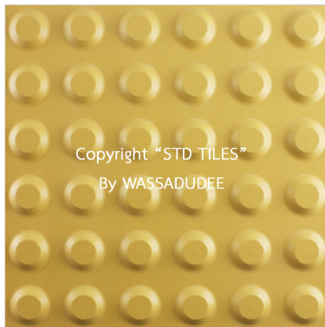
ชนิดปุ่มเตือน STD-KFQ513 (YELLOW) 300x300x15 MM.